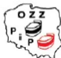
Ogólnopolski Związek Zawodowy Pielegniarek i Położnych OZZ P i P - Polska